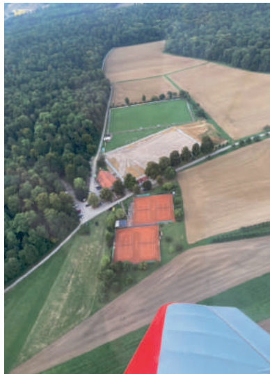
Foto aus dem Flugzeug von Walter Grandjot am 22. September 2021 nach Teilausbringung des Sandes

Die Trainingseinheiten der Aktiven wurden ab September nach Rohrau und Sulz am Eck verlegt, weil es ohne Flutlicht abends zu dunkel war. Die Jugendteams wichen auf Sportplätze der SGM-Partner Deckenpfronn und Sulz am Eck aus. Vielen Dank an die drei Nachbarvereine!