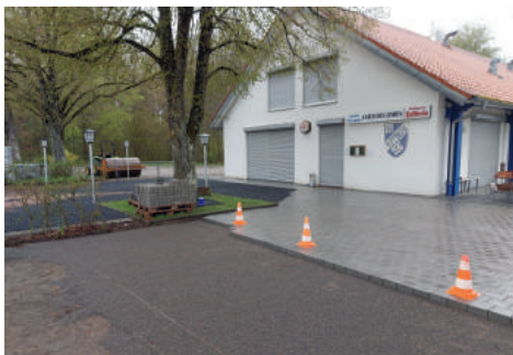
Neue Pflastersteine vor dem Sportheim