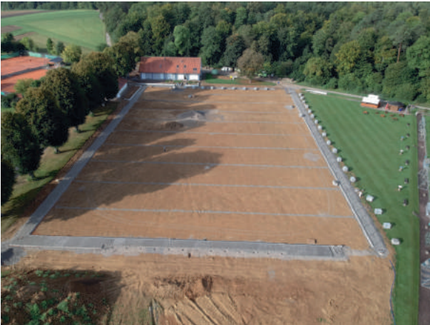
Drohnenfoto vom 11.09.2021