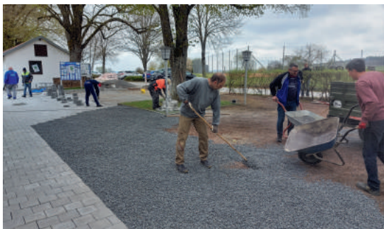
Arbeitseinsatz im April 2022 vor dem Sportheim