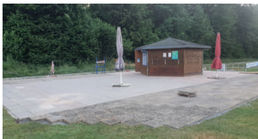
Plattenerweiterung am Verkaufsstand