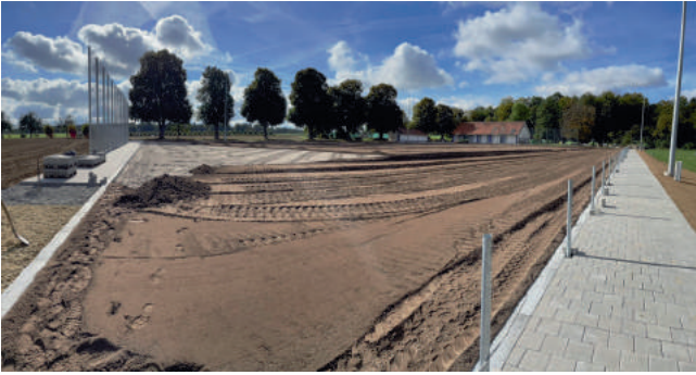
Nach der Sandschicht wird die Rasentragschicht aufgetragen