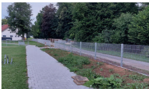
Zaun-Montage im Juni 2022