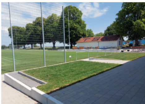
Das Gras wächst...