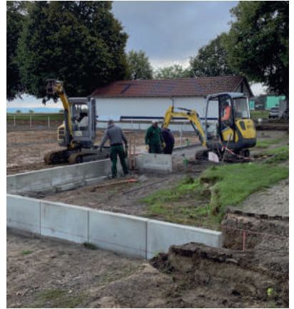
Setzen der Mauer Scheiben (L-Steine)