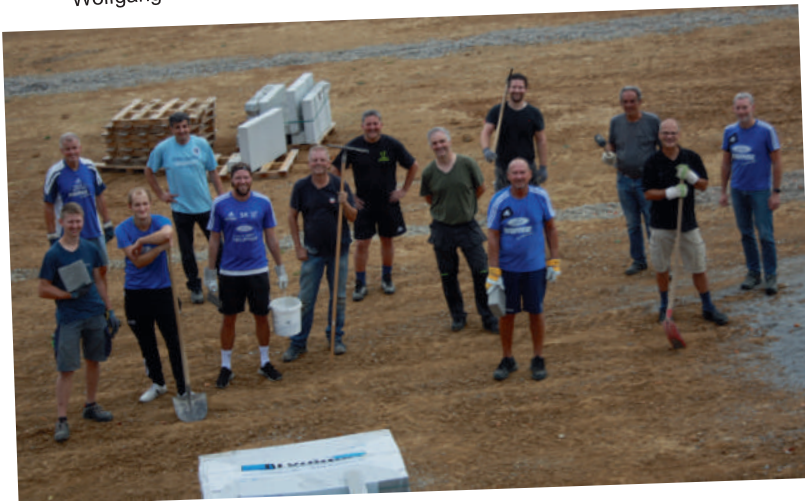
Gut besuchter Arbeitseinsatz