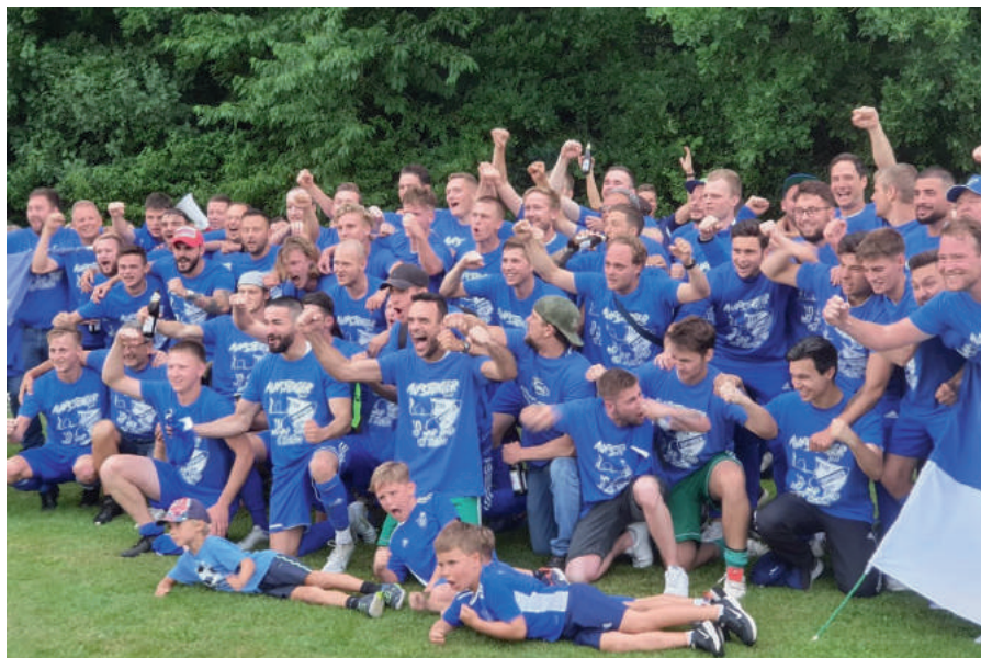
Ausgelassene Stimmung nach dem 3:0-Sieg gegen den SV Nufringen in Deckenpfronn

Mit Fertigstellung des neuen Spielfelds steigt der TSV in die Bezirksliga auf