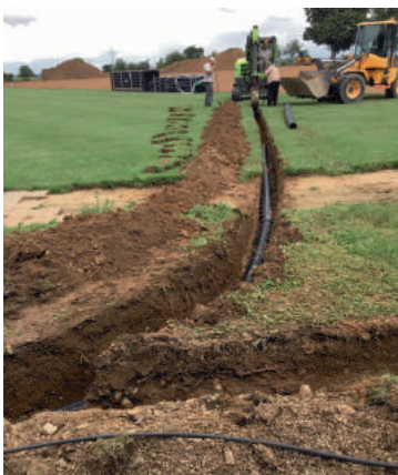
Verlegung der Sickerrohre