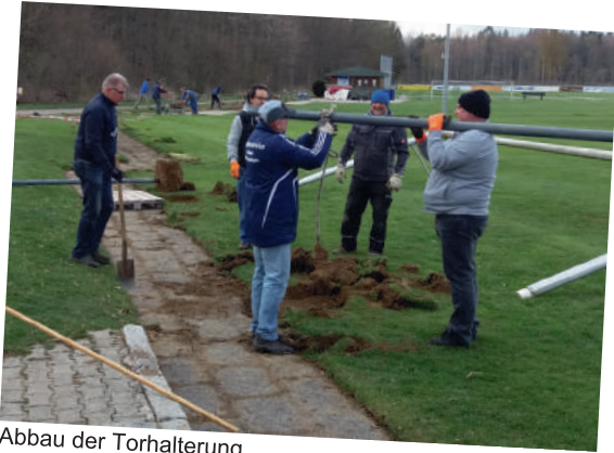
Abbau der Torhalterung